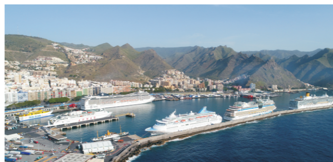
Dársena de Anaga